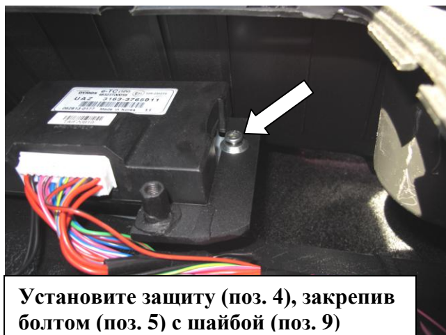
Установите защиту (поз. 4), закрепив болтом (поз. 5) с шайбой (поз. 9)