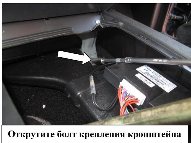
Открутите болт крепления кронштейна