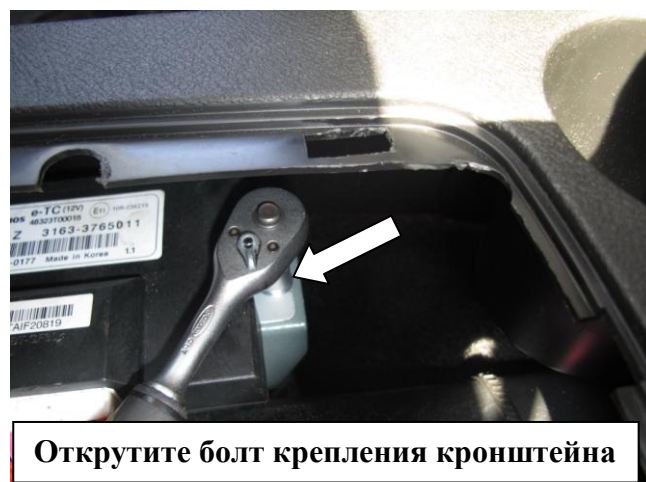
Открутите болт крепления кронштейна