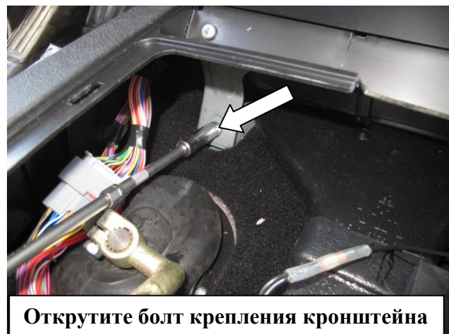
Открутите болт крепления кронштейна