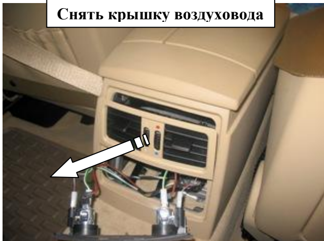
Снять крышку воздуховода