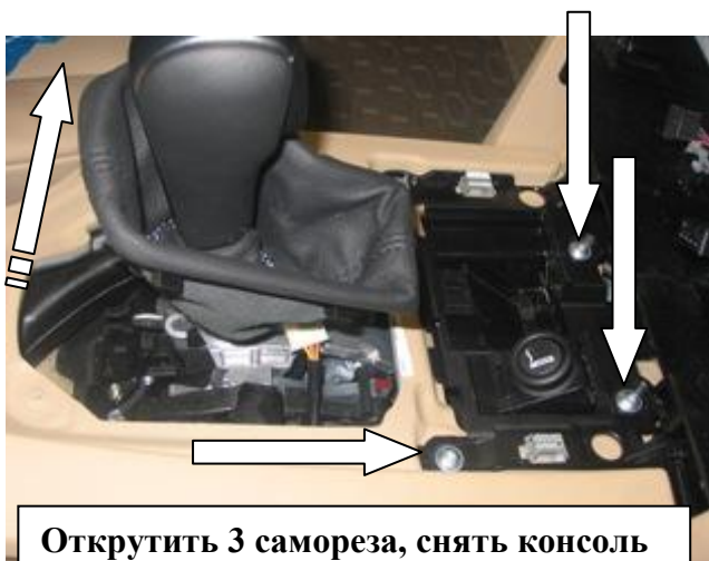
Открутить 3 самореза, снять консоль