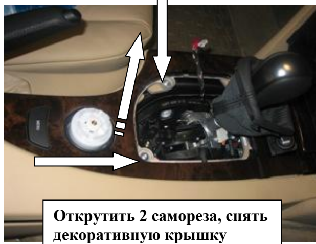
Открутить 2 самореза, снять декоративную крышку