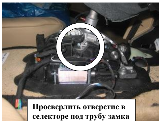
Просверлить отверстие в селекторе под трубу замка