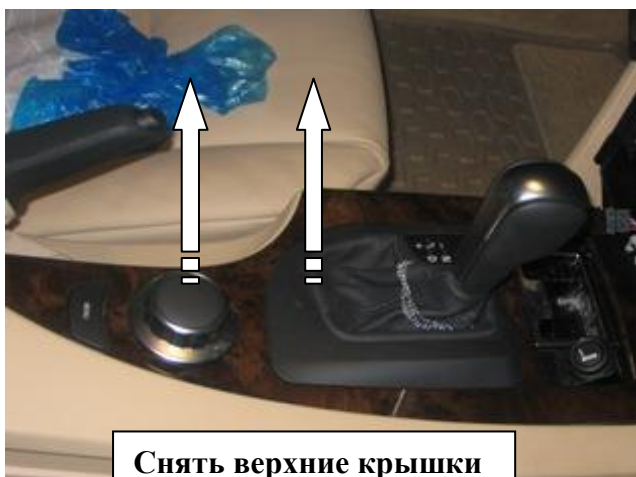
Снять верхние крышки