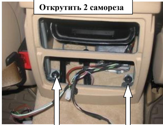
Открутить 2 самореза