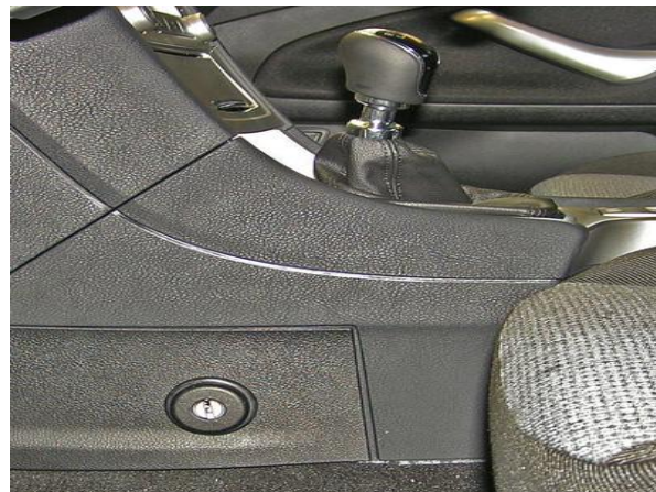
Установить консоль и боковую крышку на место