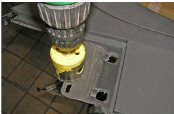
Удалить мешающий пластик консоли