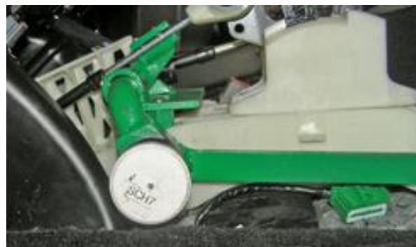
Разметить, используя разметочный шаблон, отверстие в боковой крышке под корпус замка