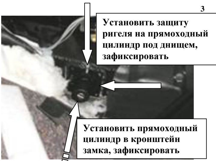
Установить защиту ригеля на прямоходный цилиндр под днищем, зафиксировать