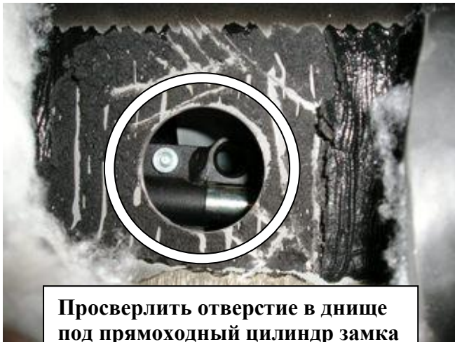
Просверлить отверстие в днище под прямоходный цилиндр замка