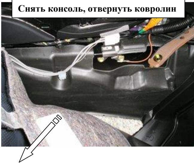
Снять консоль, отвернуть ковролин