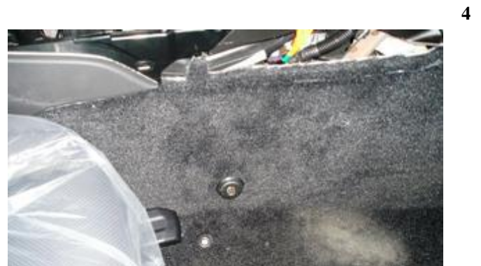
Разметить, используя разметочный шаблон, и просверлить отверстие в ковролине под цилиндр замка, установить консоль на место