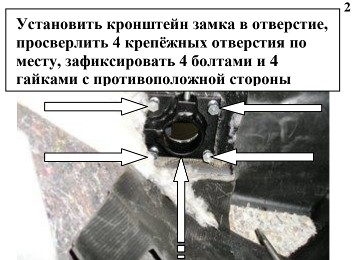
Установить кронштейн замка в отверстие, просверлить 4 крепёжных отверстия по месту, зафиксировать 4 болтами и 4 гайками с противоположной стороны